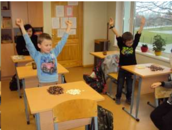
Jautrās pupiņu šķirošanas sacensības