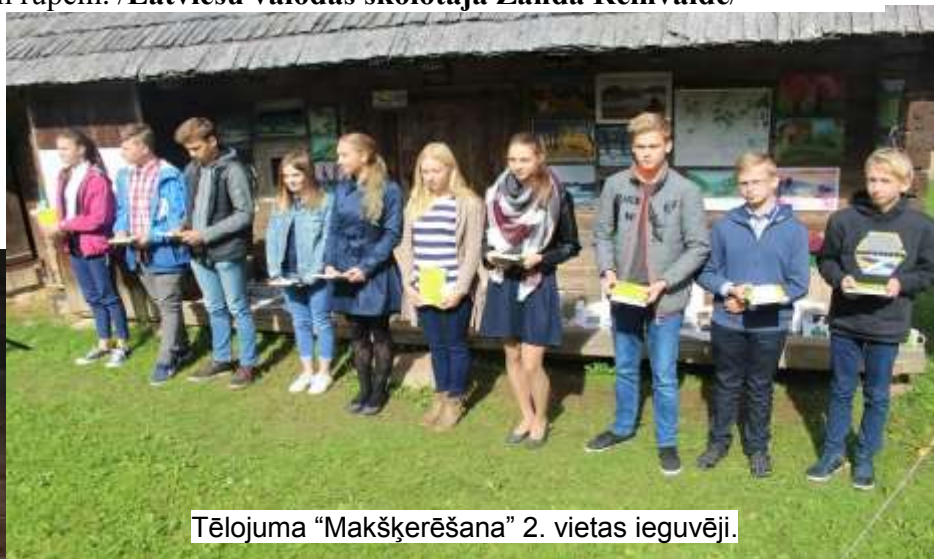
Tēlojuma “Makšķerēšana” 2. vietas ieguvēji.